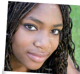
SALAMA origine Mali