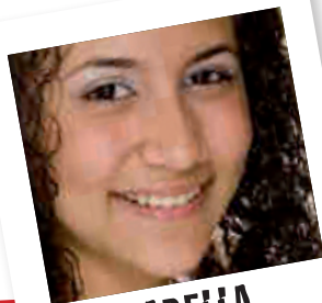
ISABELLA origine Mexique

C'est à toi de faire la démarche au Tribunal d'Instance (TI) : il ne se passera rien si tu ne bouges pas !